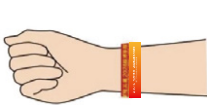
2.赛事手环 必须佩戴于手腕上(摘除或剪断无效)