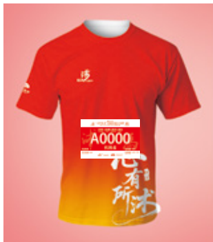
1.参赛号码簿 必须佩戴于胸前(请勿折叠或遮挡)

三、检录凭证：所有选手将2026年第三届临沭长跑节号码簿正确佩戴在胸前，赛事手环佩戴于手腕上，按号码簿颜色对应区域进行检录，如未正确佩戴号码簿或未按要求在对应区域检录，裁判有权拒绝选手入场。