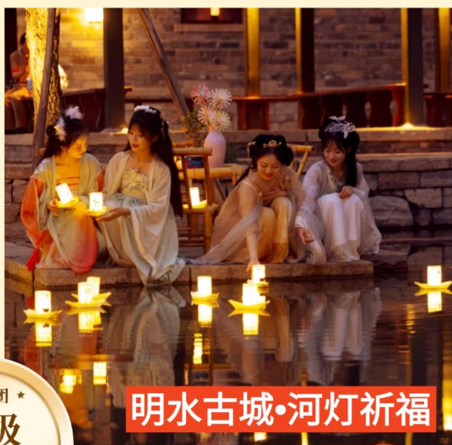
明水古城·河灯祈福