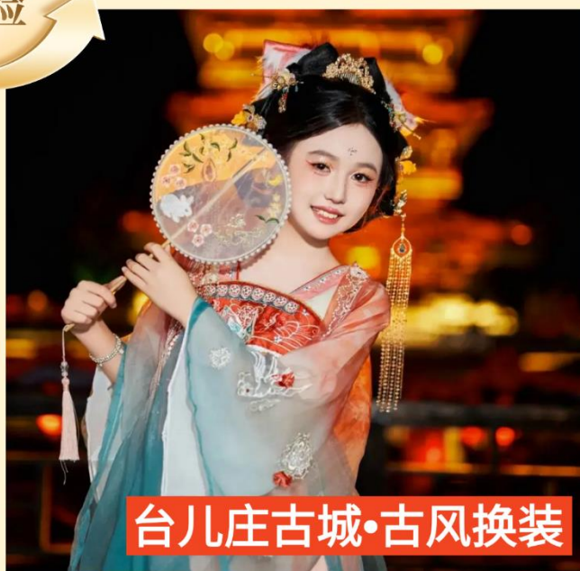
台儿庄古城·古风换装